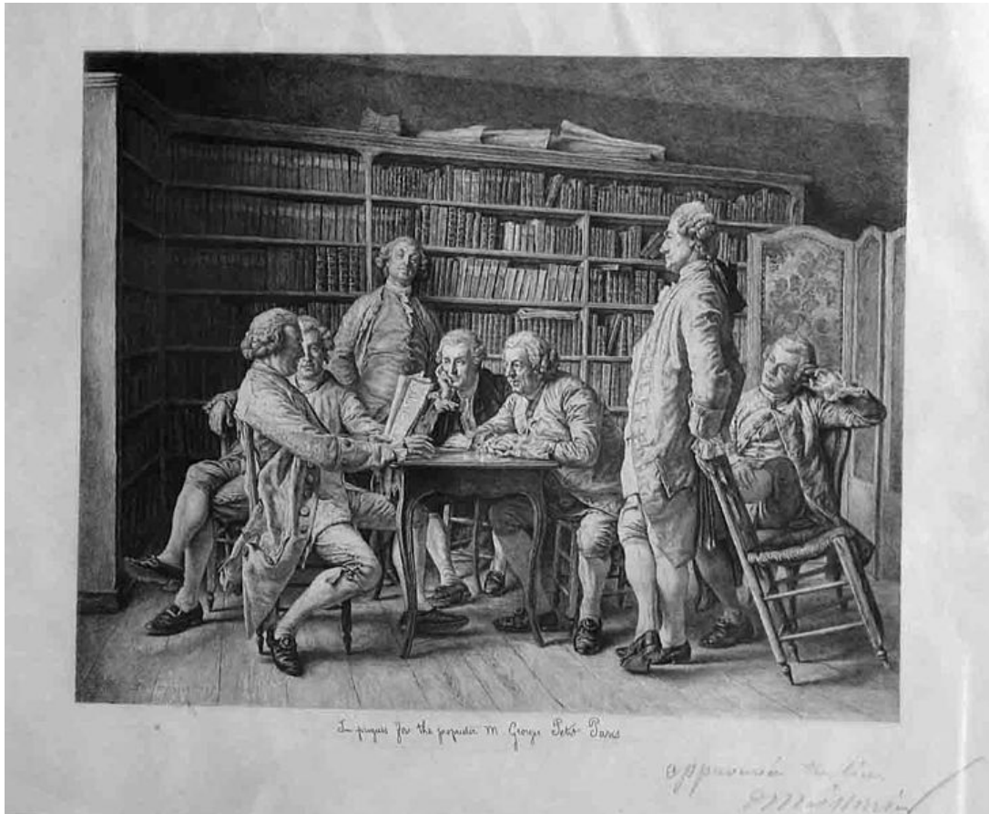
Louis Monziès, Lecture chez Diderot (Grabado)

La Ilustración fue una revolución intelectual que tuvo lugar en la segunda mitad del siglo XVIII y fue un movimiento cultural e intelectual liderado por científicos y filósofos , que se extendió por Francia, Inglaterra y Alemania y marcó el fin del Antiguo Régimen y el comienzo de una época de cambios sociales, políticos y culturales, por lo que el siglo XVIII se conoce como el "Siglo de las Luces". Es importante distinguirla de la Modernidad, aunque están estrechamente relacionadas, ya que la Ilustración fue su precursora y sentó las bases para el surgimiento de la Modernidad .