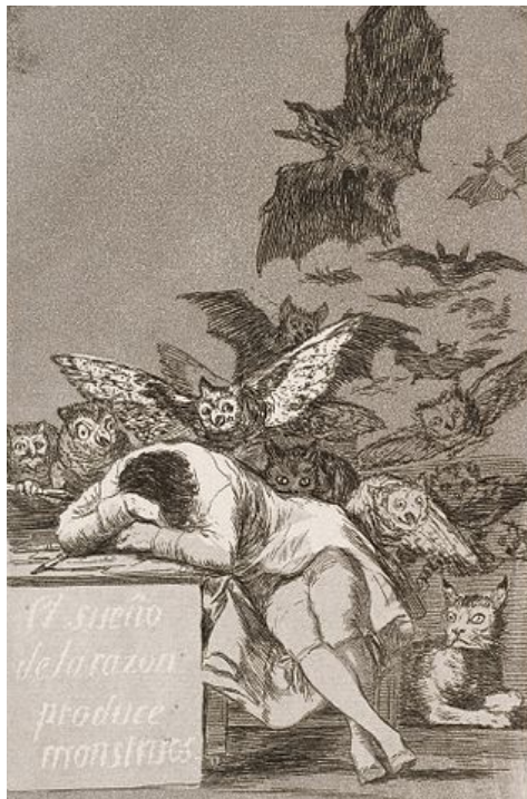
Francisco de Goya, El sueño de la razón produce monstruos , grabado n.º 43 Serie Los Caprichos (1797-1799).

Estas contradicciones llevaron a luchas, guerras e invasiones que desafiaron los ideales ilustrados de libertad, igualdad y fraternidad. Por ejemplo, las guerras e invasiones napoleónicas, que se llevaron a cabo en nombre de la razón y la libertad, causaron sufrimiento y destrucción en muchas partes de Europa. Por lo tanto, es importante reconocer tanto los logros como las limitaciones de la Ilustración para comprender su legado y sus implicaciones en la sociedad contemporánea.